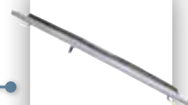
Bandes de pantographes en carbone