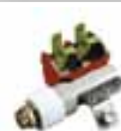
Porte-balais pour moteurs de traction